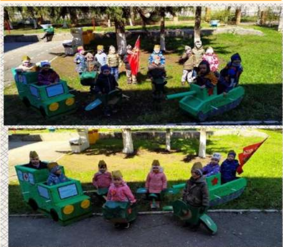
Мероприятие «День Победы!»