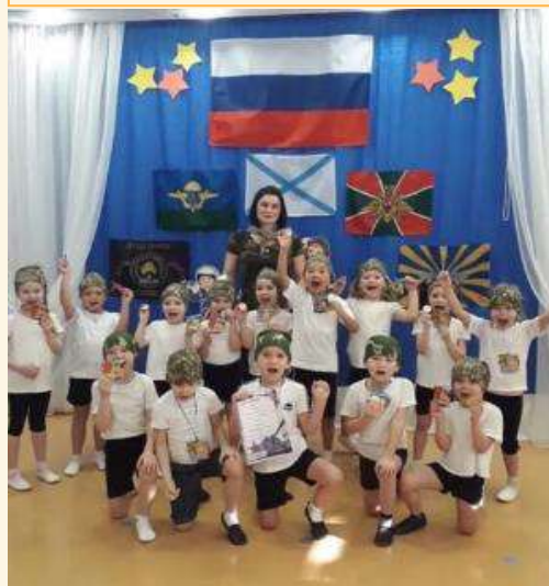
Мероприятие «Родину любить-Родине служить!»