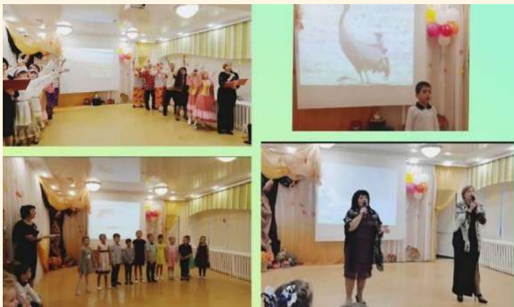
Мероприятие «История предков – наследие потомков»