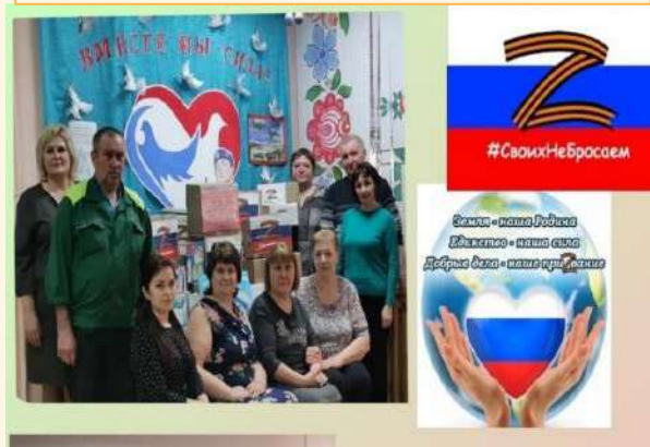
Акция «Вместе-мы сила!»