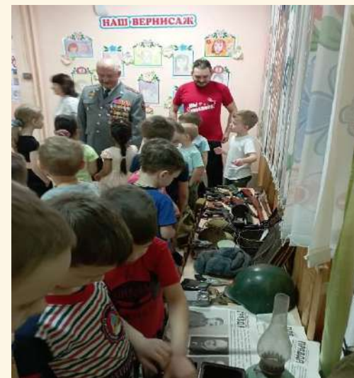
«Музей воинской славы» Военно-историческая экспозиция